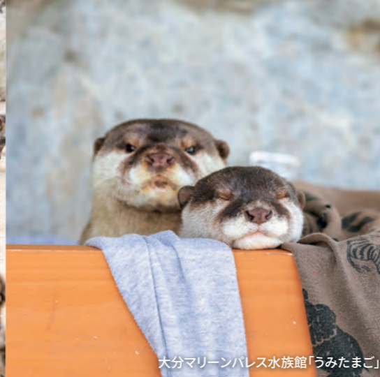
大分マリンパレス水族館「うみたまご」