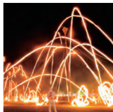
五穀豊穡・疫病退散を願って行われるお祭り。炎が飛び交う迫力満点の催しや、夜空を彩る花火は必見!

7月 なかはま 長浜神社夏祭り あすか 春日神社夏祭り せいしょうこう 清正公二十三夜祭 ななせの火群まつり