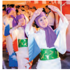
横笛や胡弓等の囃子の音に合わせ、華やかな衣装をまとった踊りが舞う姿は、大分の夏の風物詩となっています。