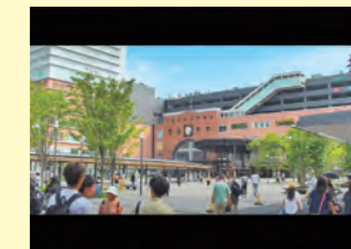
ミニトリップ大分市