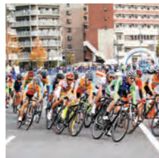
大分市内を舞台にした国内最高峰の自転車ロードレース「Jプロツアー」が開催され、毎年多くの人で賑わっています。

おおいた食と暮らしの祭典 宗麟公まつり おおいた夢色音楽祭 あまの 海部のまつり