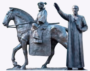
府内城跡近くの遊歩公園にある彫刻などを見ながら、宗麟の功績を辿るまち歩きをしてみませんか？ 左：伊東ドン・マンショ像 右：聖フランシスコ・ザビエル像

豊後国の英雄・大友宗麟をはじめとした偉人の足跡、往時の面影を色濃く残す街並み、貴重な史跡…。大分市の歴史を紐解く、知的好奇心を刺激する旅に出かけませんか？