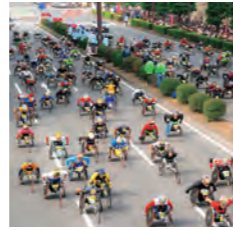
1981年から続く世界で初めての車いすだけのマラソンの国際大会。海外からも多くの方が参加します。