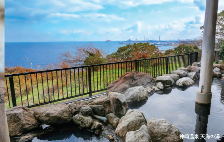
神崎温泉 天海の湯