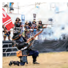
1586年の内戦「戸次川の戦い」がテーマ。荘厳な武者行列や、騎馬隊、鉄砲隊も必見です。

11月 とよ 豊の国YOSAKOIまつり のつはる ななせの里まつり 大野川合戦まつり