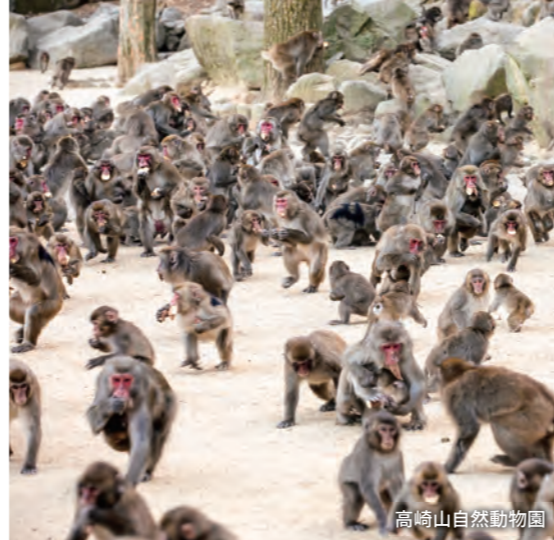
高崎山自然動物園

会いに行こう、大分市 この地に刻まれた歴史。人から人へと受け継がれてきた文化。大自然が育んだ温泉。豊潤な山海の幸。あなたの好奇心を満たす旅がそこにはあります。