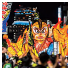
大分県最大規模のお祭り。街中が飾り付けられ、夜には府内戦紙と呼ばれる山車が威勢よく街中を練り歩きます。