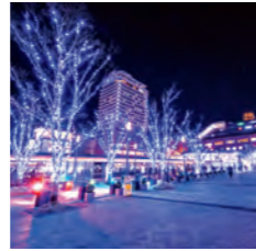
冬の大分市中心部を約43万球の光がライトアップし、街中を彩ります。

1月 すいぎょうえ 水行会 なまめ かももち 二目川百手まつり 大分ふくフェスタ