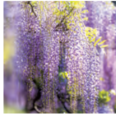
藤の名所「西寒多神社」で4月中旬～5月上旬に開催。藤の花の他、ツツジや日本伝統の歌舞・神楽も楽しめます。

4月 けん 八幡宮春季例大祭 やさか 野坂神社春季大祭 ささむた 西寒多神社ふじまつり