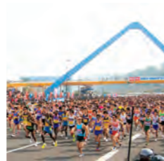
海沿いの別大国道の潮風を感じながら走る平坦なコースは、マラソンランナーの登竜門といわれています。