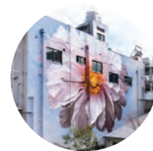
磯崎新 作 「見聞の牡丹」

アートが身近な大分市は、少し歩けばアート作品に出会えます。のんびり散策しながら、まちなかアートを探してみませんか。